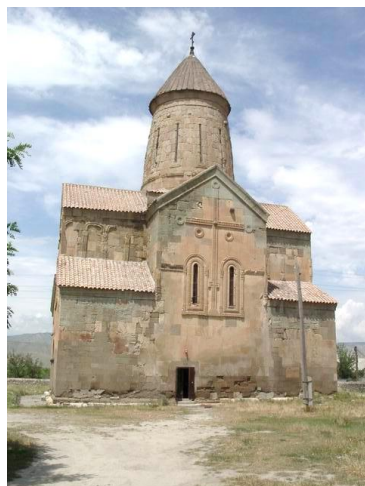
მეტეხის ღვთისმშობლის ეკლესია (#7581)