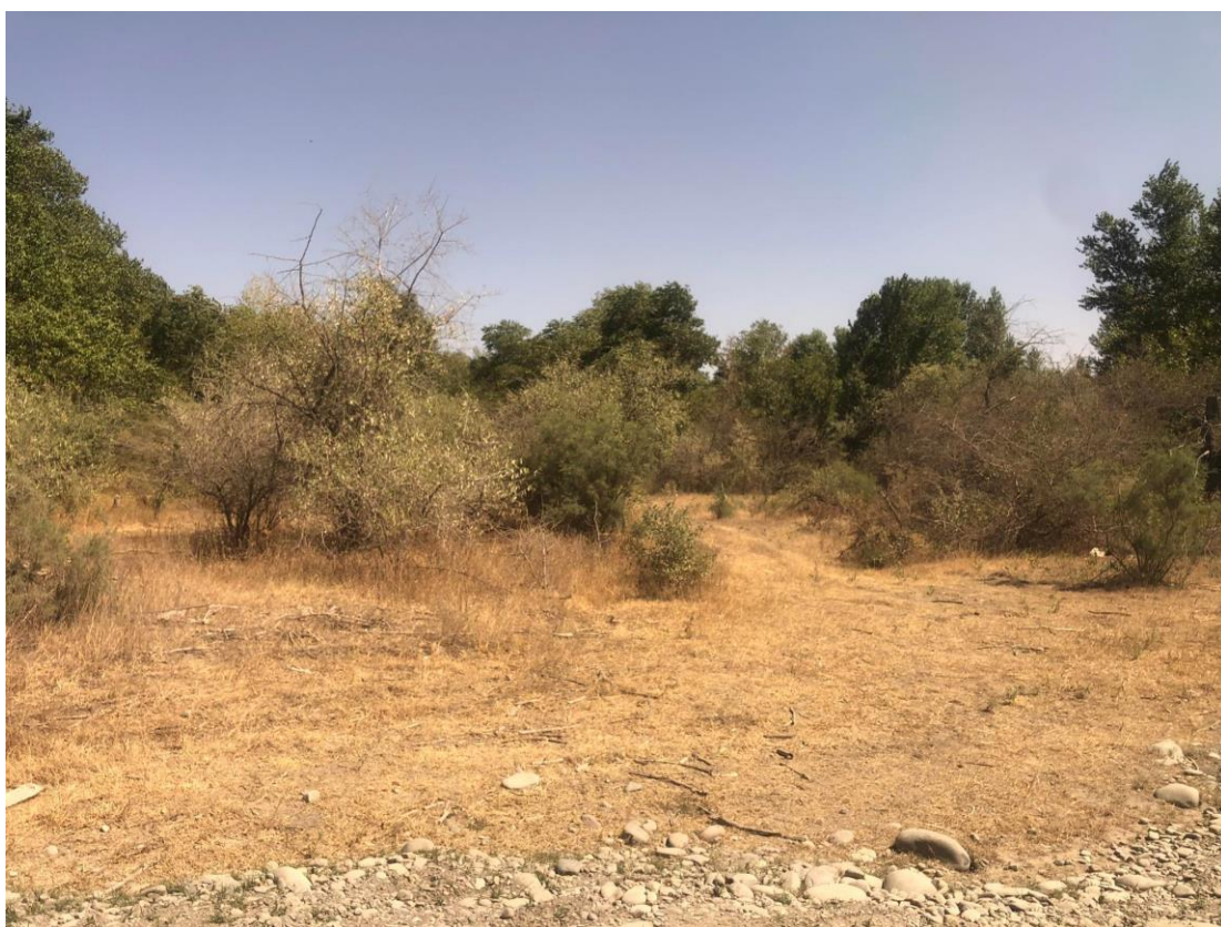
საპროექტო ტერიტორია. ხედი აღმოსავლეთით