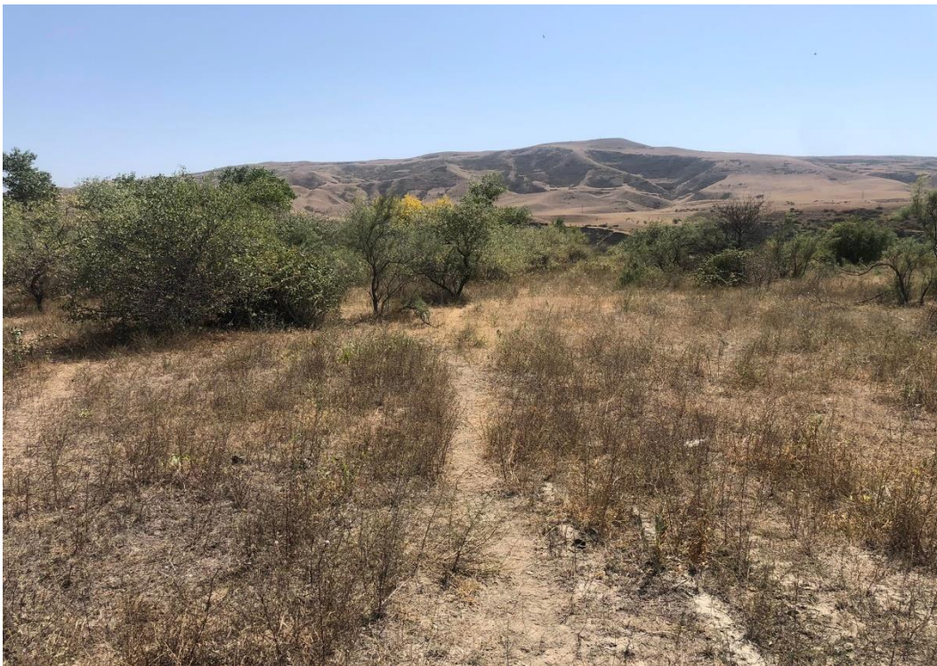
საპროექტო ტერიტორია. ხედი სამხრეთით