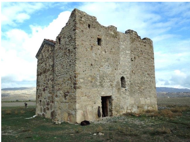
მთავარანგელოზის დარბაზული ეკლესია #5986