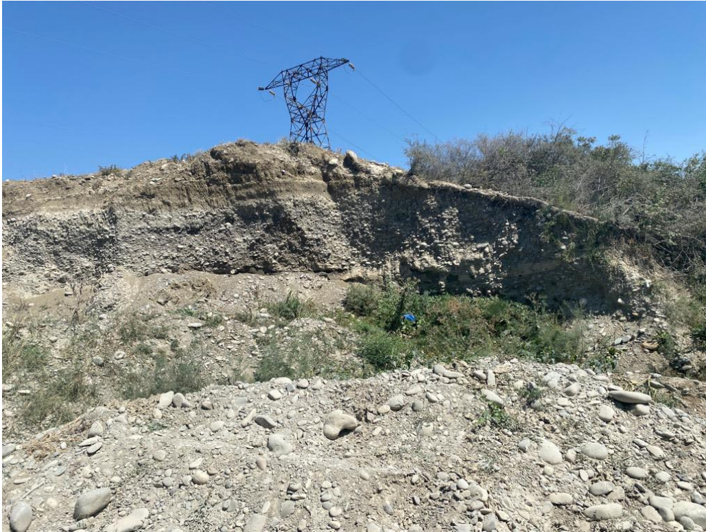
საპროექტო ტერიტორიის მიმდებარედ არსებული ვერტიკალური ჭრილები