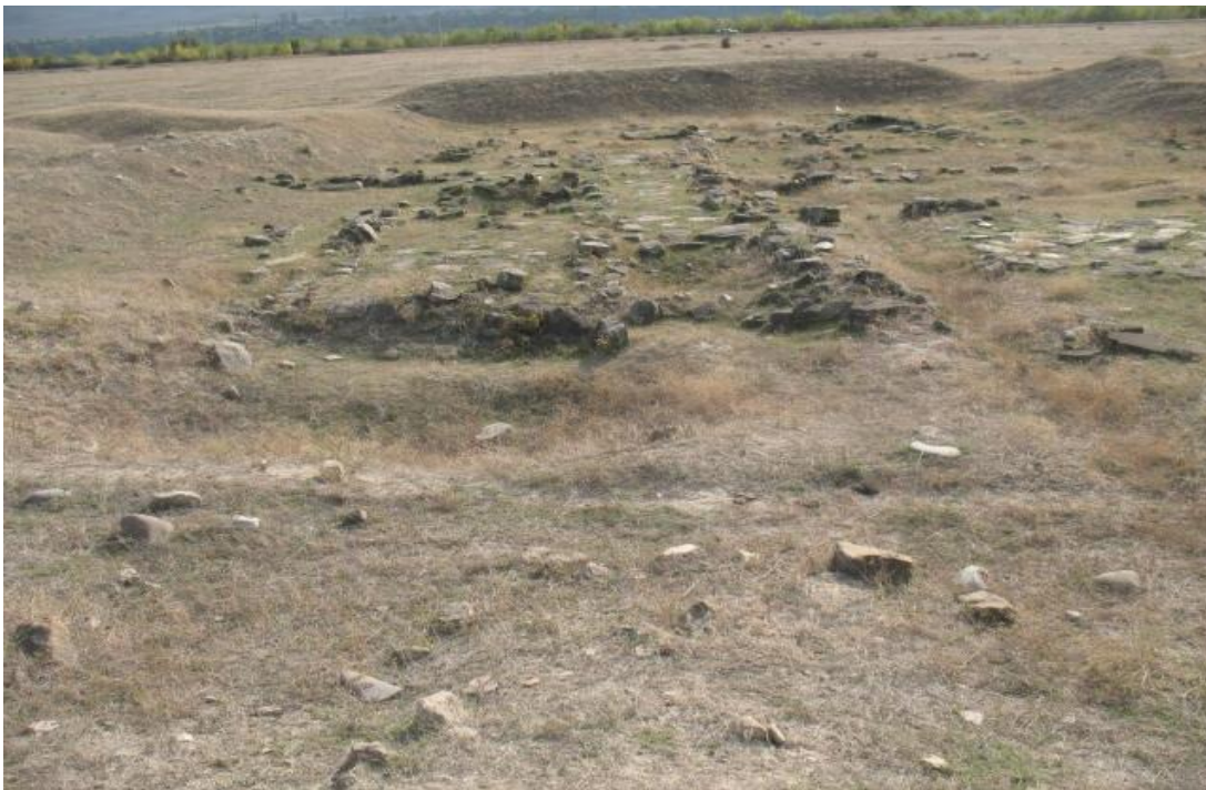
კასპის ადრე შუასაუკუნეების ნაქალაქარი და სამაროვანი #17031