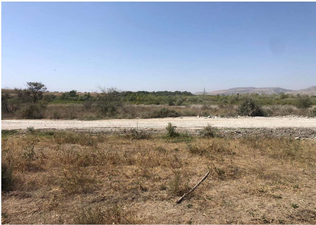
საპროექტო ტერიტორია და აქ გამავალი გრუნტის სამანქანო გზა