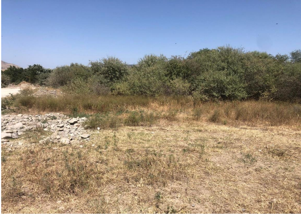
საპროექტო ტერიტორია. ხედი ჩრდილოეთით